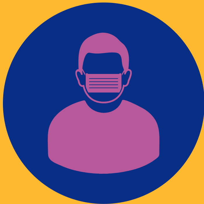
Port du masque obligatoire

Toutes les mesures nécessaires à la protection du public seront mises en place et appliquées selon le protocole sanitaire validé par le Ministère de la Santé.