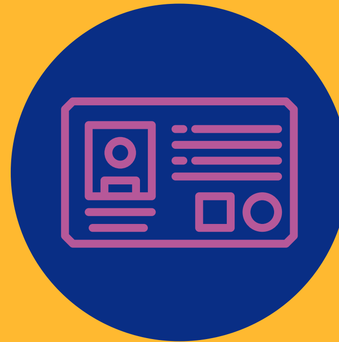
Pass Sanitaire obligatoire dès 18 ans à l'entrée de la fête *

*La preuve d'un test antigénique ou PCR négatif de moins de 48h Un justificatif attestant un schéma vaccinal complet Le résultat d'un test RT-PCR positif attestant du rétablissement de la Covid-19, datant d'au moins 11 jours et de moins de 6 mois